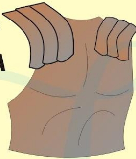
CORAZA DE JUSTICIA