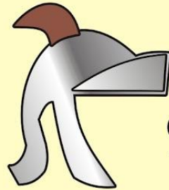
Casco de la Salvacion YELMO