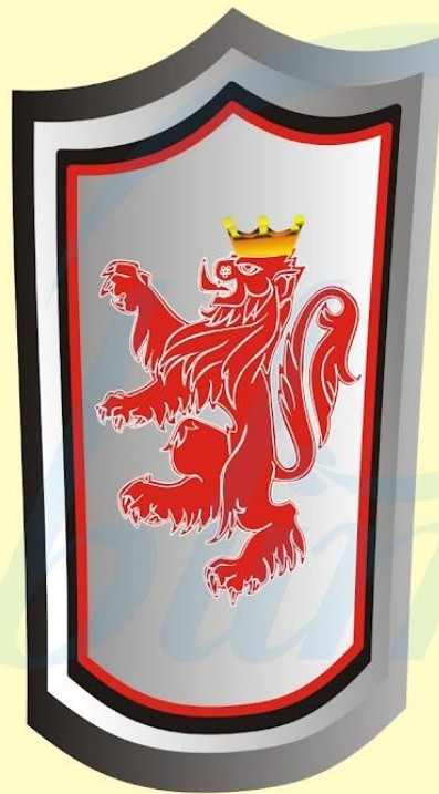
ESCUDO de la Fe