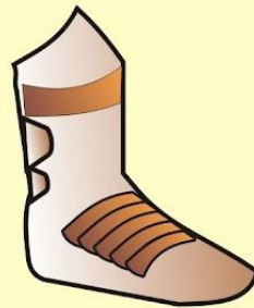
CALZADO LOS PIES CON EL APRESTO DEL EVANGELIO DE LA PAZ